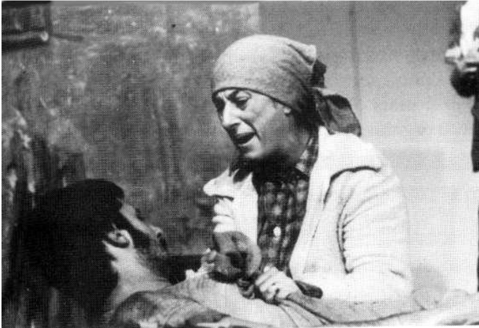
Figura 1- Antônio Fagundes e Myrian Muniz, na Primeira Feira Paulista de Opinião (1968).