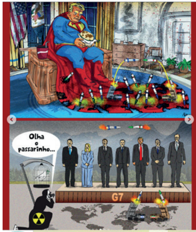
Figura 2 – Charge de Thiago Lucas, publicada na página Instagram do perfil jc_pe (@jc_pe), há 39 semanas

A imagem mobiliza o contraste entre o imaginário heroico – associado à figura do super-herói – e a leveza infantil de quem trata conflitos globais como jogo, sugerindo uma crítica à condução política baseada no espetáculo, no personalismo e na banalização da violência. Ao transformar a guerra em brinquedo, a charge denuncia, por meio do humor, a irresponsabilidade e o distanciamento das consequências reais das decisões políticas, reforçando o papel da sátira como ferramenta de questionamento e deslegitimação simbólica do poder.