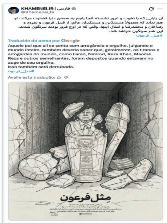
Figura 1 – charge publicada no X por Ali Khamenei

Essa dimensão é particularmente relevante em um contexto em que acusações de crimes de guerra, agressões internacionais e ataques ao Estado de direito atravessam o debate público. O humor não substitui a justiça, mas participa da disputa simbólica que a antecede. Ele cria fissuras na narrativa dominante, abre espaço para o dissenso, mobiliza afetos.