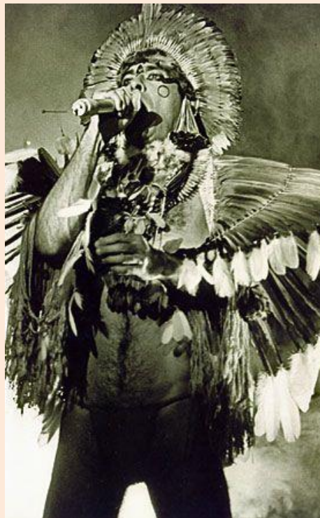
O índio-ave pleno que se altera ao longo do show.