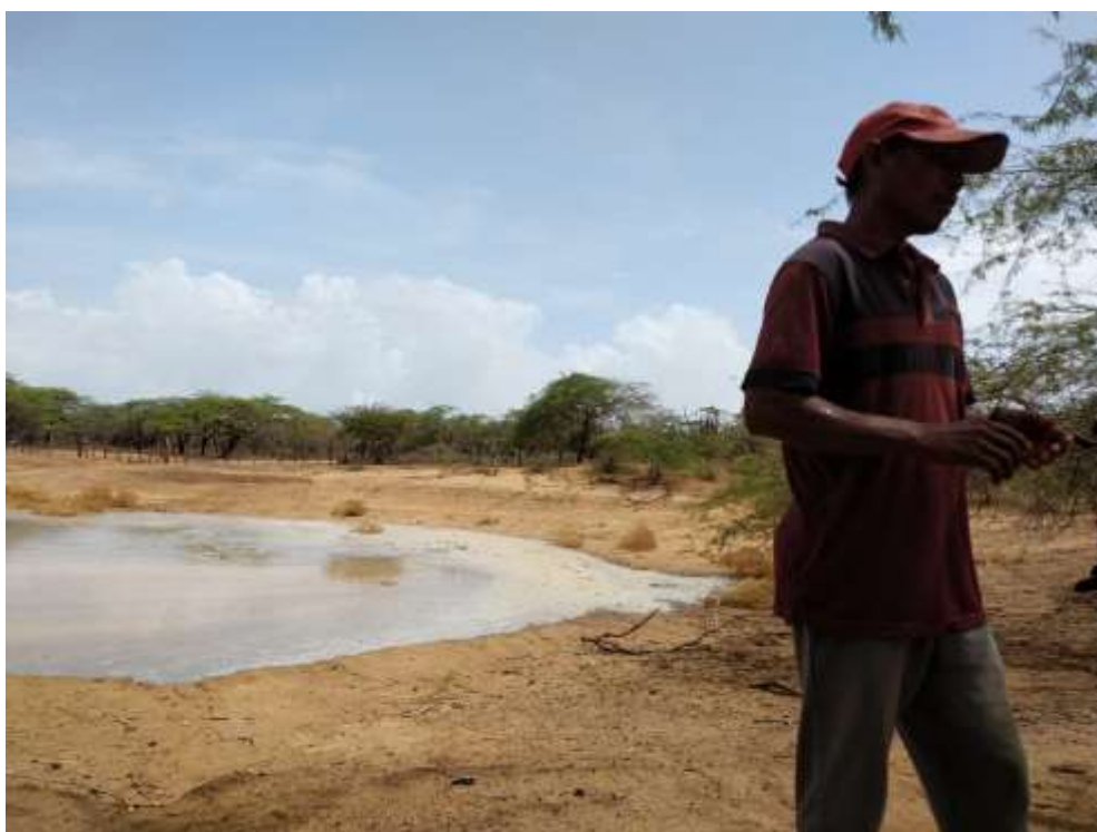
Figura 2: Imagen del jaguey de la comunidad Nueva Esperanza

depósitos, etc. así como otros sistemas de desalinización y purificación del agua son necesarios ya que, el agua que consumen no cumple las mínimas recomendaciones de agua dispuestas por la OMS.