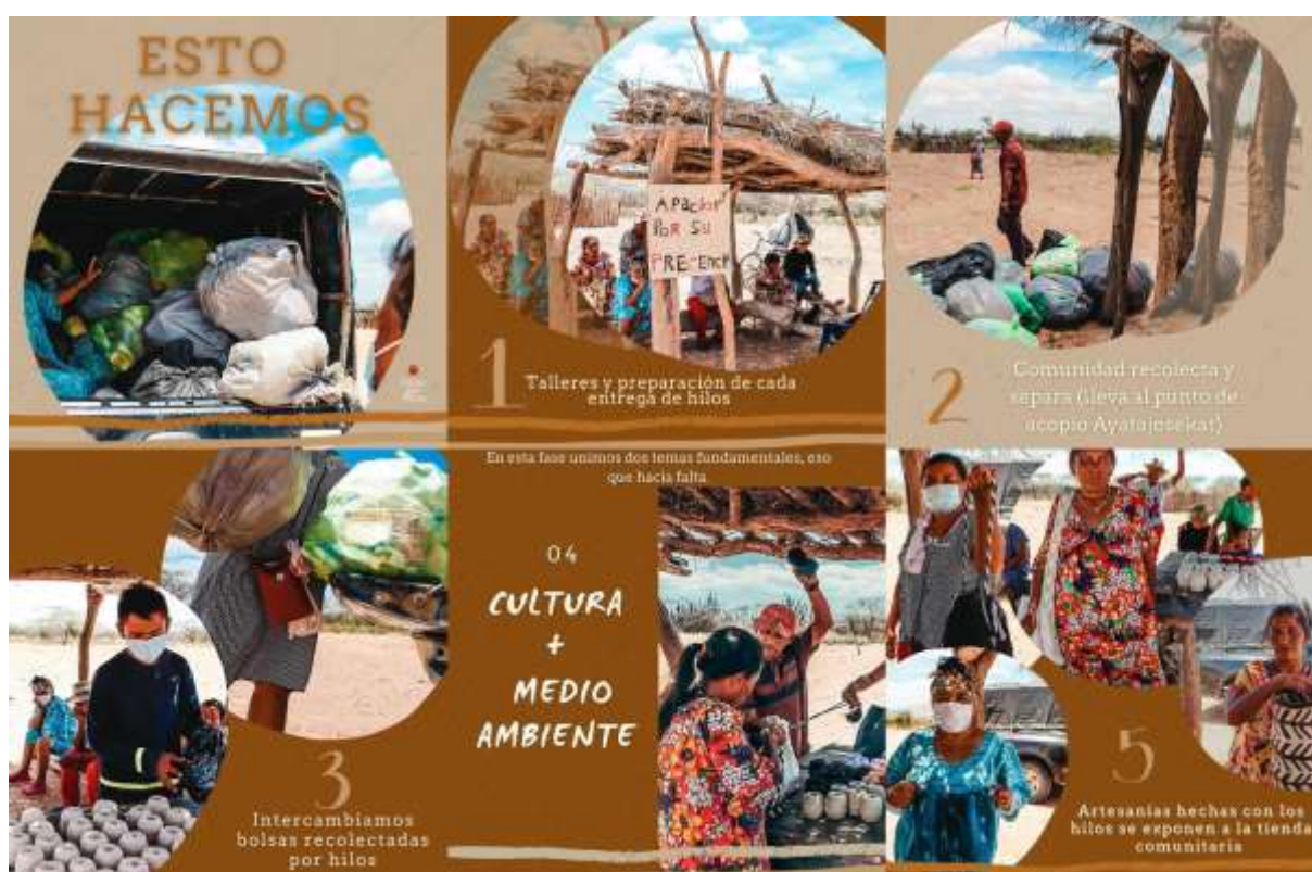
Figura 3: Etapas del proceso en el proyecto Hilos por Mma.