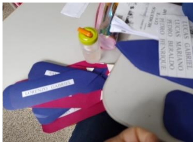
Figura 7: Fichas nominais

Confeccionamos fichas nominais que para auxiliar as crianças na escrita de seu nome. Na sequência foto das fichas sendo produzidas. Ao centro a residente Elenice auxiliando um aluno na identificação das letras do seu nome com o apoio da ficha nominal e alfabeto móvel.