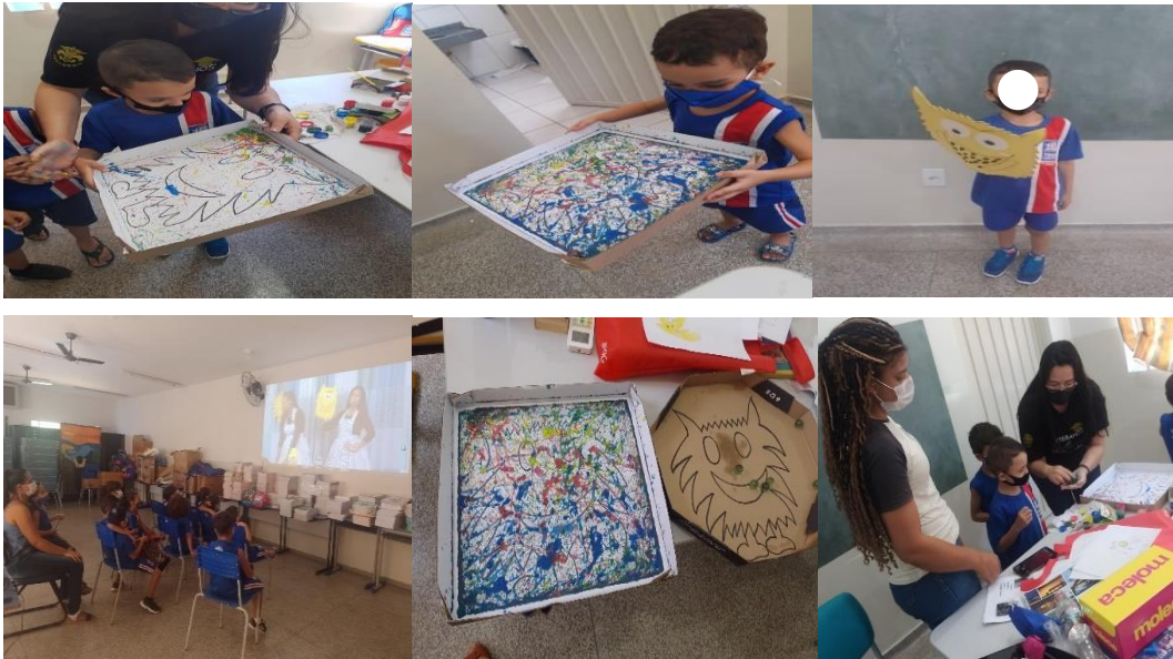
Figura 13: História “O monstro das cores”