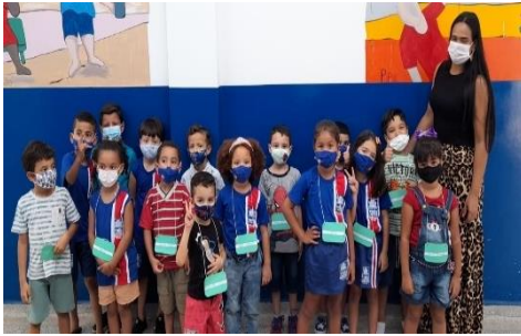
Figura 10: Foto da turma junto com a preceptora.