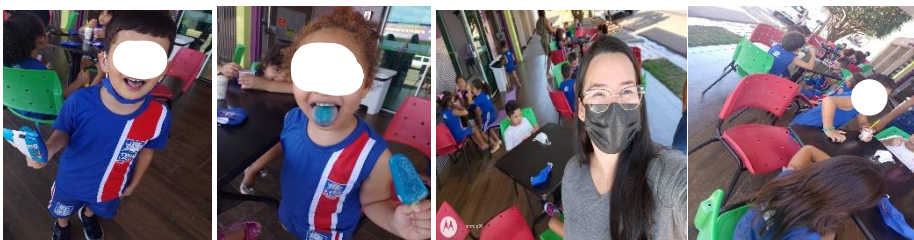
Figura 16: Crianças na sorveteria do bairro.

Dia do passeio “Hoje é dia de picolé!”: Levamos as crianças para um passeio nos entornos da escola e até a sorveteria do bairro. Essa vivência foi cheia de significados para eles e importantíssima aos residentes. Poder observar o que elas já sabiam sobre as ruas do bairro, sobre os comércios locais e principalmente quando se davam conta de que a escola era próxima aos locais que a maioria já conhecia e frequentava com a família, foi enriquecedor e trouxe inúmeros aprendizados para minha docência.