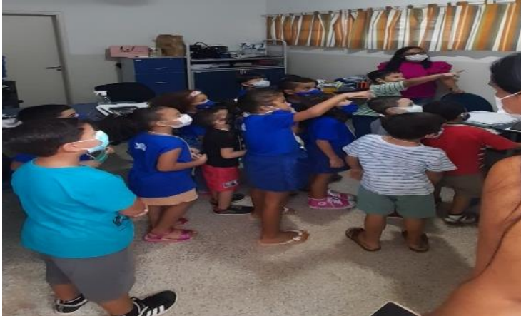
Figura 15: Conhecendo minha escola.

das crianças e as levou até a sala onde ficam as telas do monitoramento. Foram tantas perguntas, brincadeiras, risadas, muitas hipóteses levantadas por eles, se enxergavam nas telas e cada momento era um que ia para fora dar um aceno para as câmeras... as tecnologias e suas aprendizagens!