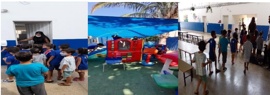
Figura 14: Conhecendo as dependências escolar.

Realizamos com as crianças um passeio pela escola: “Reconhecendo minha escola”. Foi apresentado às crianças as dependências do prédio escolar, sala dos professores, direção, coordenação, pátio, refeitório, quadra, parquinho etc., bem como os colaboradores. Apresentar os espaços escolares para a criança é de suma importância para que, ela conheça os espaços, aprenda a se localizar e confie nos membros da equipe escolar.