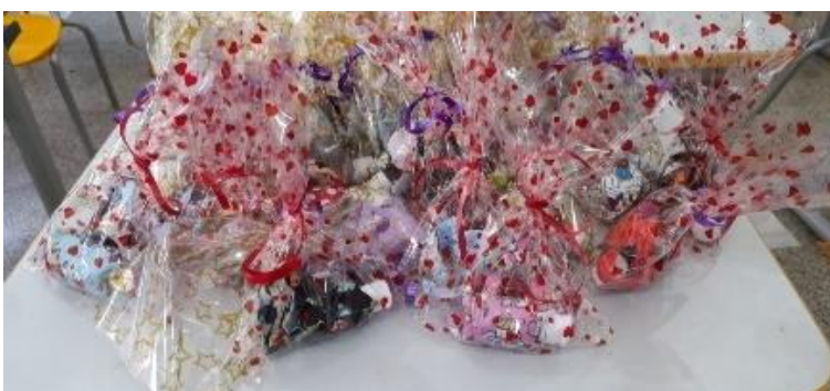
Figura 9: Lembrança.

Lembrança: foi confeccionado uma bolsinha de tecido para adaptar um frasco pequeno de álcool em gel. Entregamos para as crianças no primeiro dia de vivência do projeto e solicitamos que deixassem o recipiente na mochila para usarem com frequência.