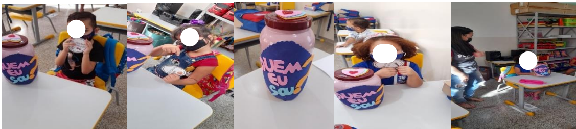
Figura 12: Dinâmica “Quem sou eu?”

Confeção dos recursos utilizados na dinâmica “Quem sou eu?”. Decoramos uma lata com a pergunta da dinâmica, imprimimos e adesivamos perguntas para estimular a interação das crianças com os colegas, como forma de conhecerem uns aos outros, gostos musicais, preferências em jogos, brincadeiras e cores, se possuem animais de estimação, perguntas relacionadas às famílias entre outras.