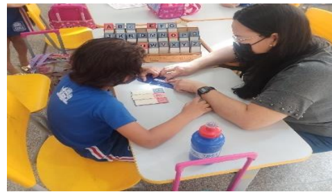
Figura 8: Residente auxiliando aluno na escrita