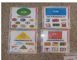
Figura 1, 2, 3, 4, 5 e 6: Recursos lúdicos produzidos.

Organização da sala de aula com recursos lúdicos visuais – materiais de apoio, produzidos pelos residentes, sendo eles cartazes “Como está o tempo hoje?”, “Quantos somos?”, “Aniversariante do dia”, “Calendário” “Formas geométricas”, “Ajudante do dia”, “placa de Bem-vindos”, painel para foto “1º dia de vivência”, este último recurso, fora utilizado nas duas primeiras semanas, tendo em vista, a matrícula de novos/as alunos/as