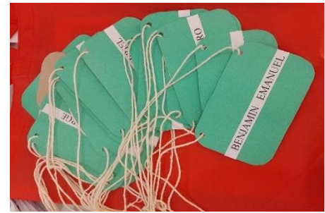
Figura 11: Crachás confeccionados