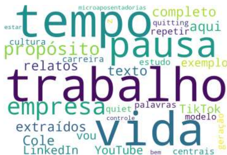
Figura 1: Nuvem de Palavras gerada pela Estatística Textual do IRaMuTeQ