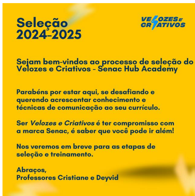
Figura 2: Campanha de seleção dos "Velozes e Criativos" ciclo 2024-2025