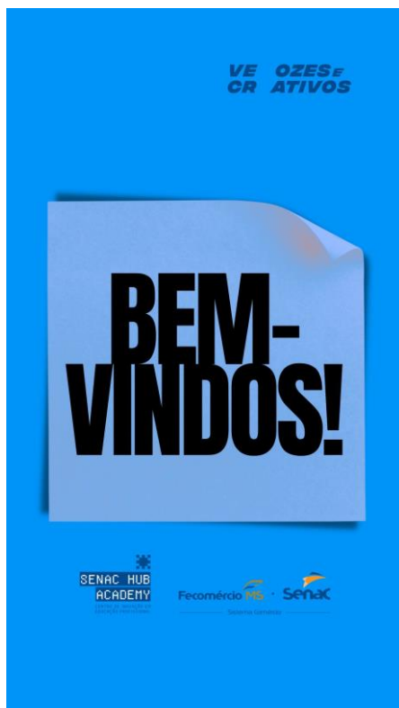
Figura 3: Exemplo de produção para divulgação do Senac Hub Academy

O projeto logrou êxito ao alcançar diretamente 45 alunos, entre 2024 e 2025, da Aprendizagem Profissional, que atuaram como protagonistas na comunicação e divulgação institucional. O volume de produção técnica foi expressivo, totalizando a publicação de mais de 120 vídeos institucionais, incluindo, pelo menos, quatro formaturas por mês. Estes conteúdos alimentaram as redes sociais da instituição, geraram um aumento orgânico no engajamento do público externo, e as TVs corporativas internas, veiculando conteúdos das ações internas e fortalecendo o sentimento de pertencimento da comunidade ao verem suas próprias atividades diárias retratadas.