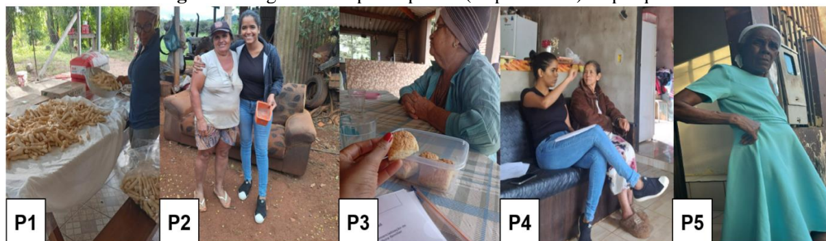
Figura 3: Registros das participantes (respondentes) da pesquisa