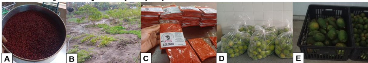
Figura 4: Alguns dos principais produtos cultivados e manufaturados na AMA

Assim, a Figura 4, a seguir, exhibe alguns dos principais produtos atualmente cultivados nas propriedades das respondentes, sendo que parte deles também é manufaturado na própria associação.