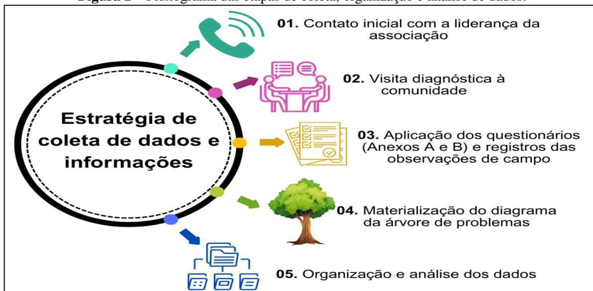
Figura 2 – Fluxograma das etapas de coleta, organização e análise de dados.