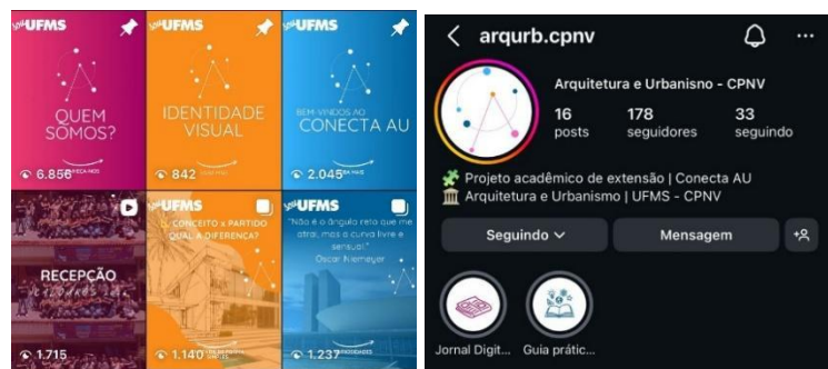
Figuras 01, 02 e 03: jornal CONECTA AU EM PAUTA, paleta de cores e postagens no Instagram e perfil do Instagram, respectivamente.

A metodologia do projeto foi organizada em um ciclo contínuo de planejamento, execução, monitoramento e avaliação ao longo de 12 meses, iniciados em agosto de 2025. Esse processo foi dividido em quatro fases: planejamento e estruturação; produção e lançamento; manutenção e expansão; e, por fim, avaliação e planejamento futuro, garantindo aprimoramento constante das ações.