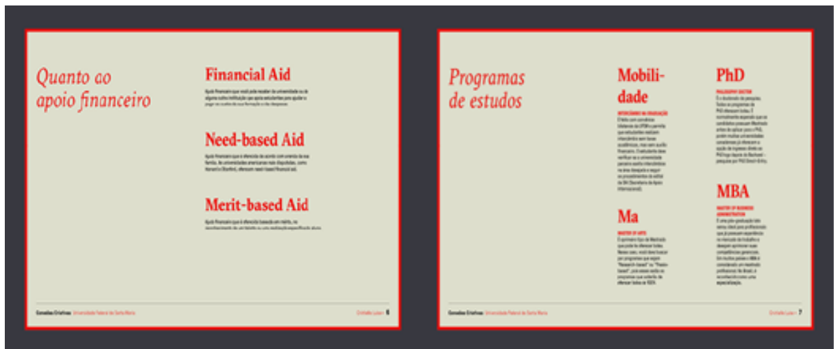
Figura 8 - Seção de Apoio financeiro e Programas de estudos na apresentação do projeto Conexões Criativas

Além disso, há uma seção dedicada aos principais tipos de bolsas, com distinções entre auxílios por mérito ( merit-based aid ) e por necessidade ( need-based aid ) (Figura 8).