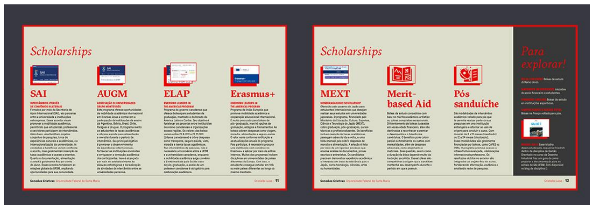
Figura 9 - Seção de bolsas -scholarships- na apresentação do projeto Conexões Criativas

Cada um desses programas foi descrito de forma objetiva, com ênfase nos critérios de elegibilidade e nos apoios concedidos, como auxílio financeiro, isenção de taxas acadêmicas e suporte à estadia.