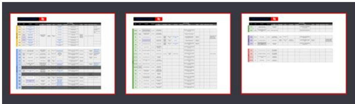
Figura 6 - Planilha com o levantamento de dados do projeto Conexões Criativas

Essa organização permite que os estudantes filtrem as oportunidades com base em suas necessidades acadêmicas, financeiras e profissionais, contribuindo para decisões mais assertivas e alinhadas aos seus objetivos.