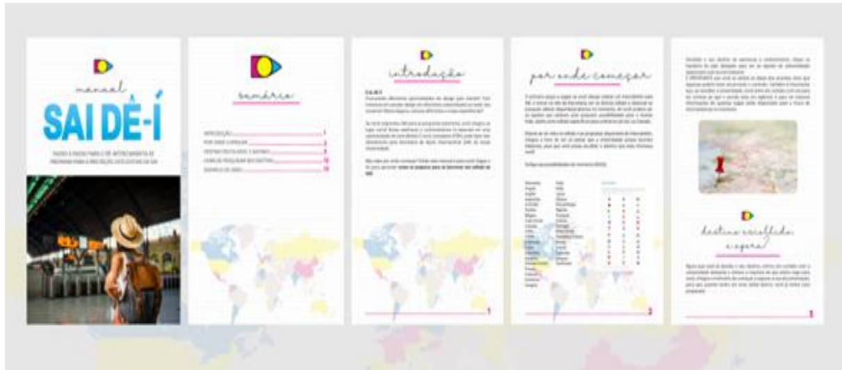
Figura 1 - seção 1 do Manual Sai Dê-Í