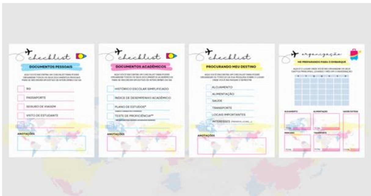
Figura 5 - checklists e materiais de apoio do Manual Sai Dê-Í

Todos os checklists e materiais de apoio desenvolvidos (Figura 5) foram reunidos ao final do manual, que está disponível on-line por meio da plataforma Issuu (Petroni, 2024).