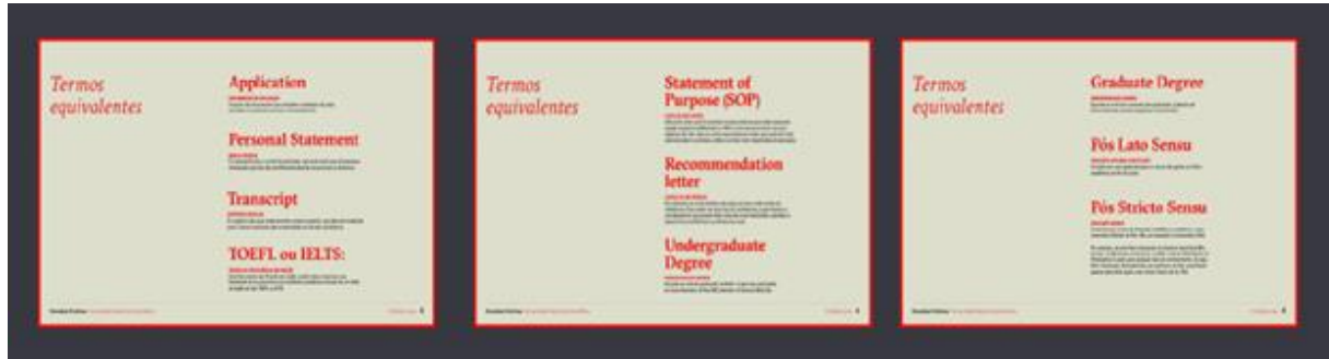
Figura 7 - Seção de termos equivalentes na apresentação de Conexões Criativas

momento de interpretar os requisitos das candidaturas, contribuindo para uma compreensão mais clara das etapas e documentos envolvidos.