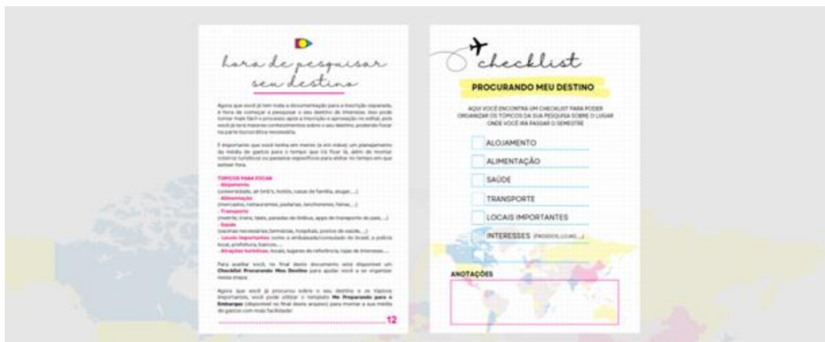
Figura 3 - seção 3 do Manual Sai Dê-Í