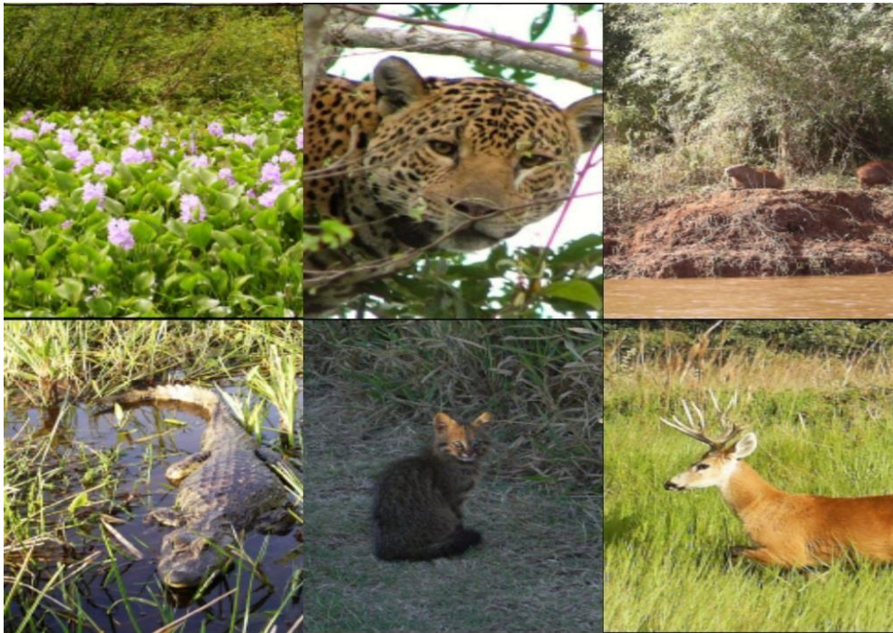
Figura 2: Algumas das Espécies Nativas do Parque Estadual das Várzeas do Rio Ivinhema