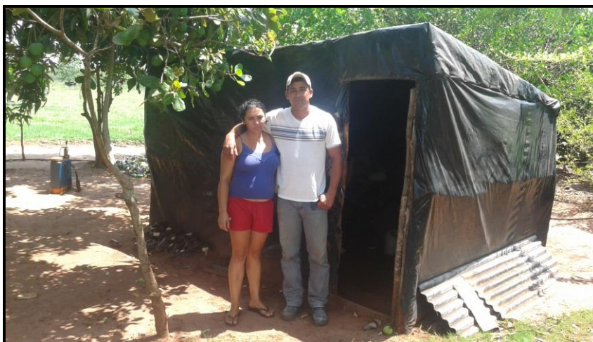
Figura 1: Do barraco de lona à casa de alvenaria no Assentamento São João (assentado SJ3).