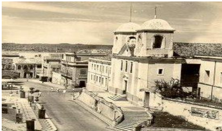
Figura 1: Igreja do Carmo, onde funcionou a “Aula de Pedagogia”.