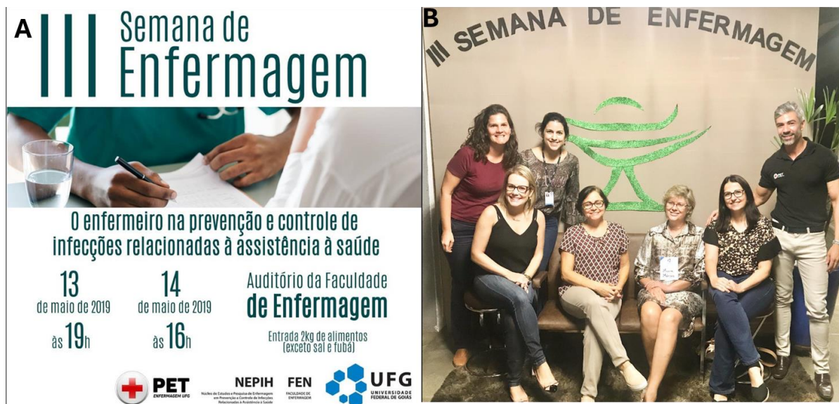
Figura 3- III Semana de Enfermagem do Programa de Educação Tutorial. Goiânia, 2019. A- folder do evento com a programação. B- Professores da Faculdade de Enfermagem e tutor do grupo, representando o envolvimento dos docentes na Semana de Enfermagem do PET.

O destaque dado para o papel do enfermeiro na prevenção e controle de infecções acabou coincidindo com o ano da descoberta do primeiro caso da infecção pelo SARS-Cov-2.