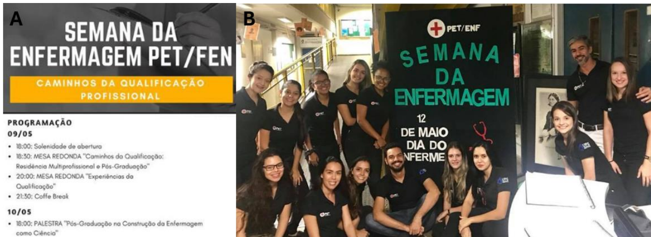
Figura 2- II Semana de Enfermagem do Programa de Educação Tutorial. A- folder do evento com a programação. B- Equipe organizadora do evento constituída pelos alunos do PET do ano de 2018 e tutor do grupo.

Redação Científica e Tecnologias de Intervenção de Enfermagem em Famílias. A figura 2 ilustra a programação e o grupo PET durante o evento.