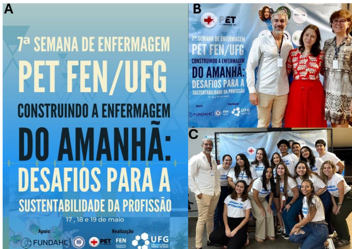
Figura 7- VII Semana de Enfermagem do Programa de Educação Tutorial. Goiânia, 2023. A-Folder do evento. B - Tutor e Palestrantes convidados C- Equipe organizadora constituída pelos discentes do PET e tutor do programa.