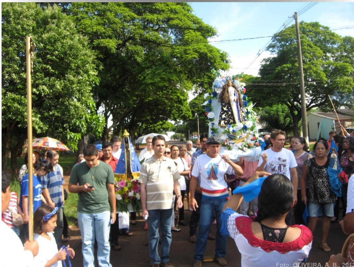
FOTO 02 – ORAÇÃO DO PAI NOSSO E DA AVE MARIA EM ESPANHOL APÓS O ENCONTRO DAS DUAS PROCISSÕES.