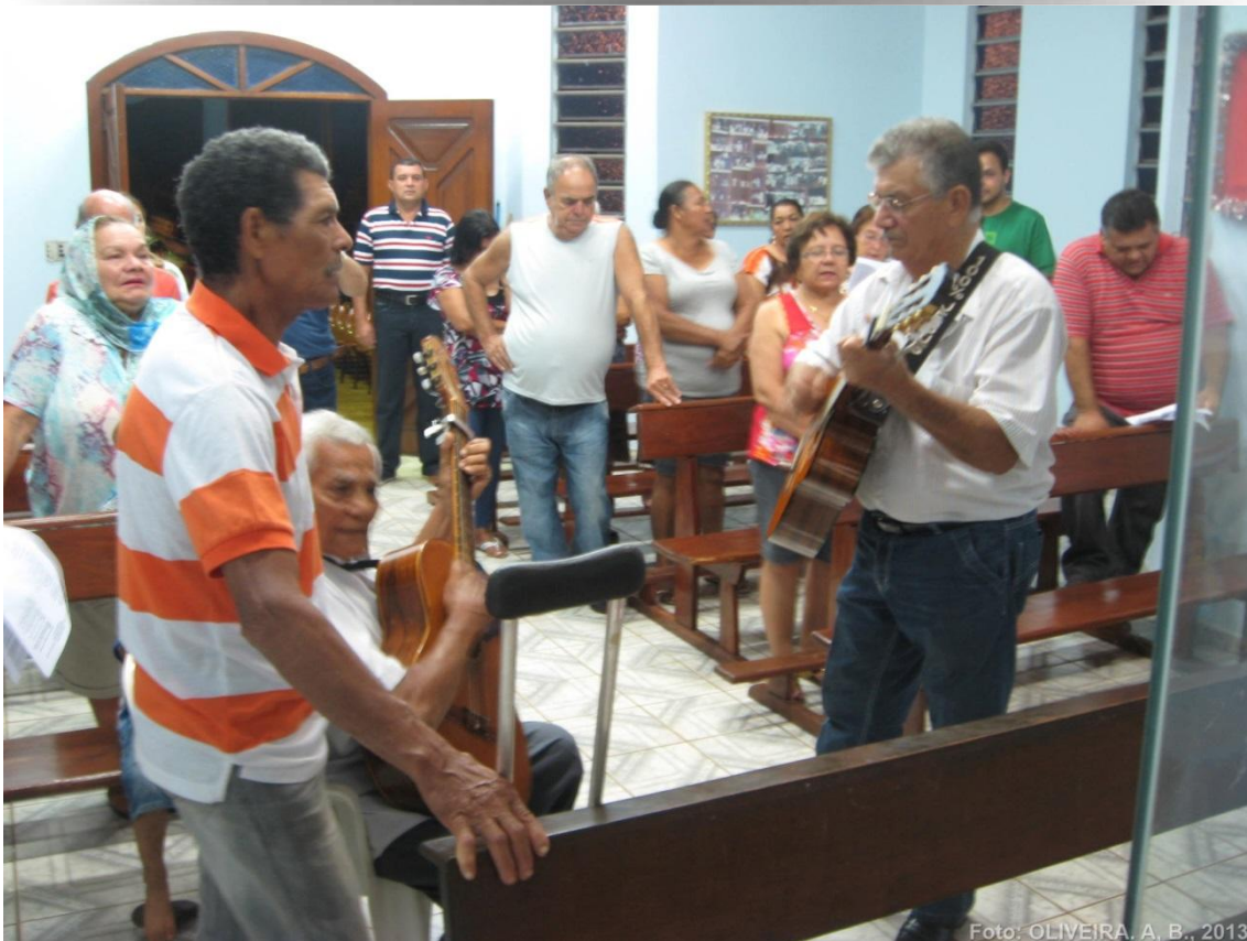
FOTO 01 – SERENATA EM HOMENAGEM A NOSSA SENHORA DE CAACUPÉ