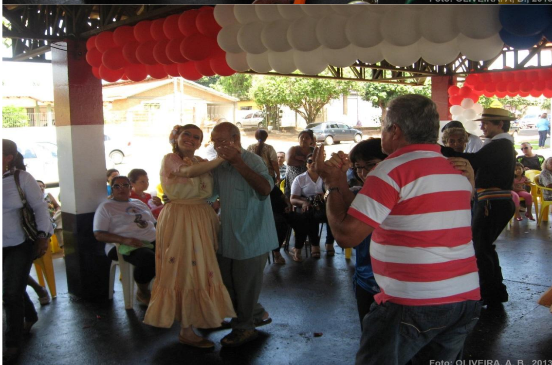
FOTO 03 – O MESMO LOCAL SENDO OCUPADO POR DIFERENTES TERRITORIALIDADES