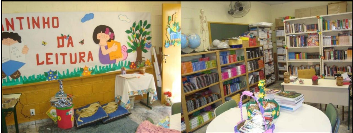
Figura 7: Biblioteca e “cantinho” reservado especialmente à leitura.