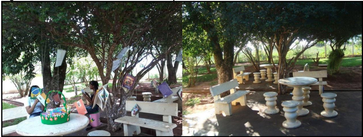
Figura 8: Semana da leitura embaixo da jabuticabeira na E.E. João Carreira