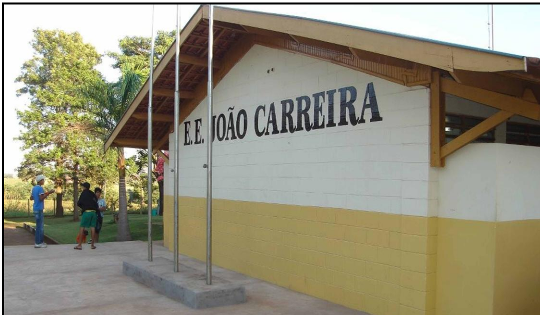
Figura 3: Vista frontal da E.E João Carreira

Segundo informações de Andradina (2011-2014), desde os anos 60 funcionavam escolas isoladas de 1ª a 4ª séries nessa região. Chegaram a funcionar 19 escolinhas rurais espalhadas pela fazenda. No local onde está a E.E. João Carreira (Figura 3) funcionava a escola do Bairro Cambira com duas salas de aula de madeira na década de 60. Posteriormente construíram-se duas salas de alvenaria (década de 70).