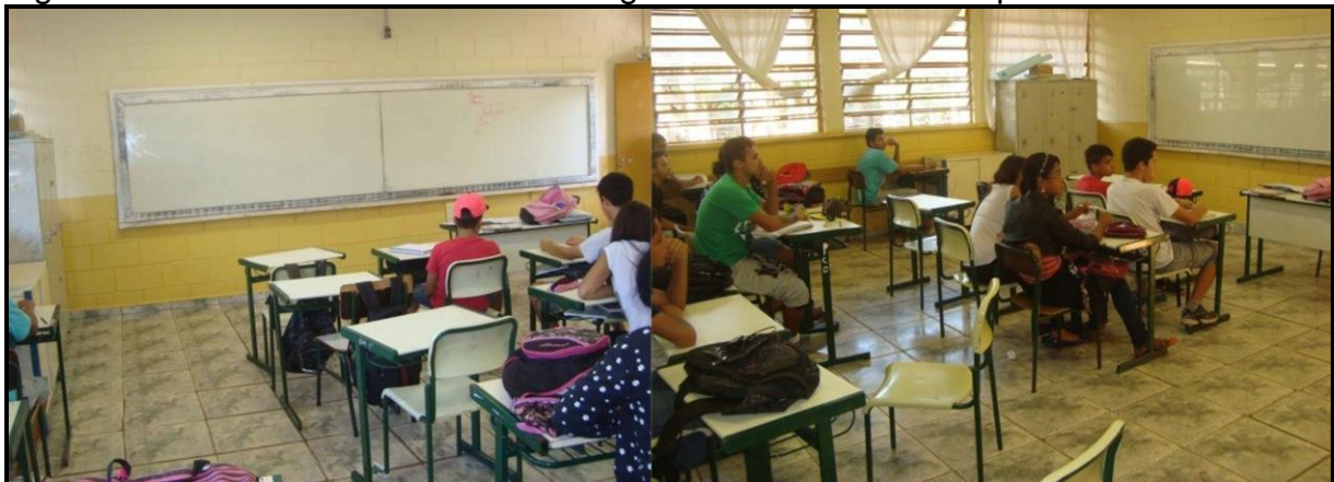
Figura 6: Sala multisseriada em dois ângulos do 8º e 9º ano vespertino.