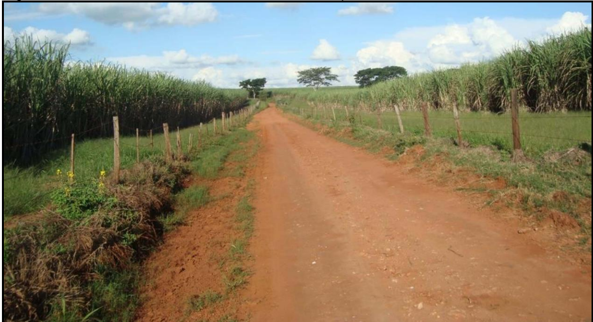
Figura 1: Estrada dentro da Fazenda Primavera que dá acesso a E.E. João Carreira