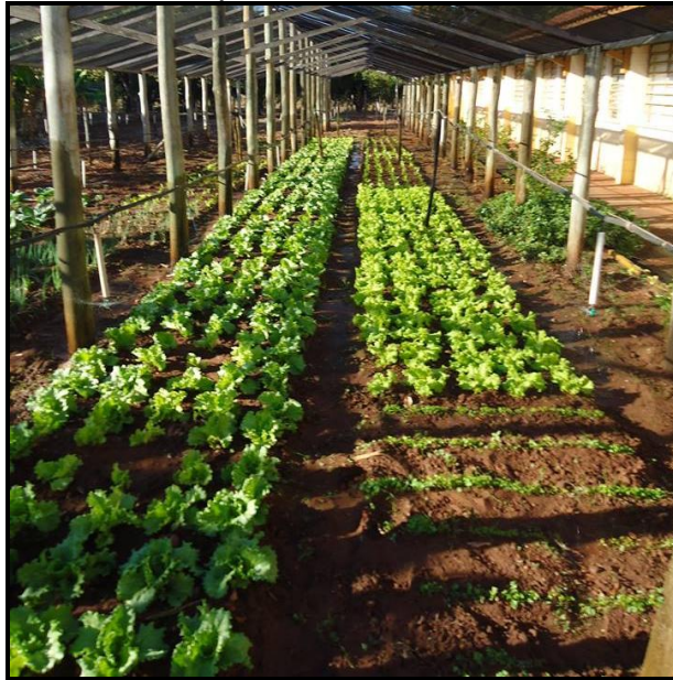
Figura 5: Horta orgânica cultivada pelos alunos da E.E João Carreira.