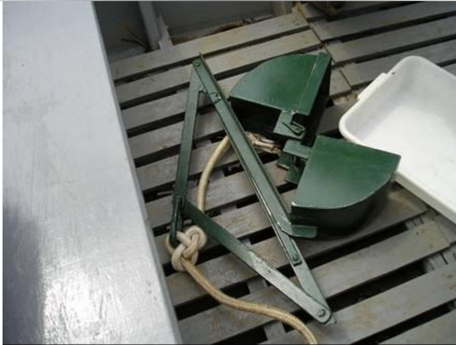
Figura 3 – Equipamento utilizado na coleta de material em campo.

As amostras do material de fundo passaram pelo processo de secagem em estufa, durante algumas horas até que a umidade fosse totalmente removida. Após esta etapa as amostras foram divididas em quatro partes, por meio do processo de quarteamento (SUGUIO, 1973).