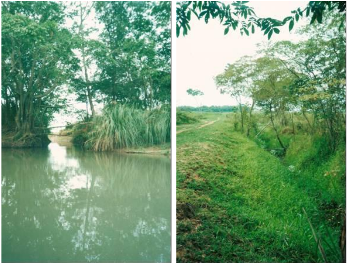
Figura 4: Drenos que desembocam no canal Curutuba.

De acordo com Souza Filho (1999), o processo de desmatamento na região iniciou-se nas áreas altas na década de sessenta, atingindo seu auge nos anos oitenta, período em que quase toda a vegetação foi retirada. Nas áreas baixas (leques), por serem úmidas, permaneceram quase intocados até os anos oitenta. Na década seguinte, a instalação de canais artificiais (drenos) permitiu que essas áreas fossem drenadas e, posteriormente, substituindo a vegetação nativa por pastagens, como observado nesta pesquisa (Figura 4).