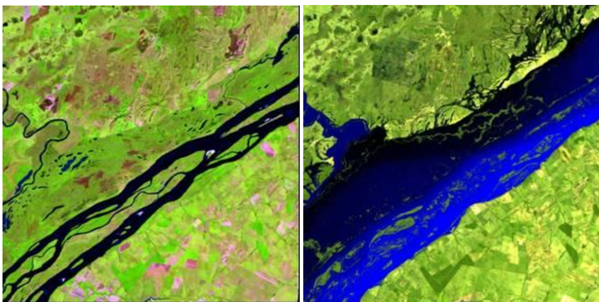
Figura 2: Imagens Landsat, bandas 3, 4 e 5 rgb - área de estudo. Período de vazante (esq) e de cheia (dir).

A região caracteriza-se por apresentar um grande número de lagoas que durante as cheias se interconectam com os canais ativos da planície (canal Curutuba e os rios Baía e Ivinheima), deixando assim de ser ambientes lânticos 7 e tornando-se semi-lóticos num processo que apresenta considerável importância no que diz respeito ao processo reprodutivo dos seres aquáticos, uma vez que esta é uma área de reprodução.