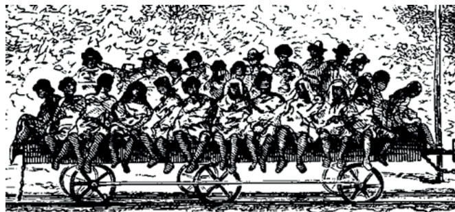
Gráfico 2. ¿Negros en las vías del Paraguay en 1872?