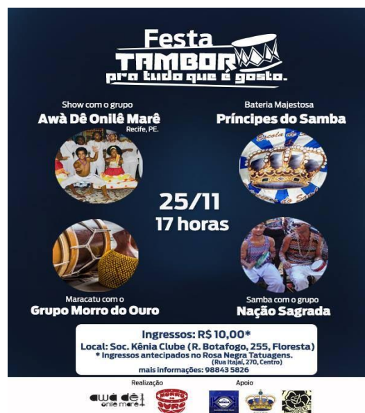
Figura 1 – Cartaz do projeto Festa do Tambor pra Tudo que é Gosto, de 2016

Além do mais, os grupos sofriam retaliações ao tentar ensaiar em espaços públicos da cidade. O Kênia Clube abriu as portas, e foi onde os grupos percussivos conseguiram realizar suas ações e guardar seus instrumentos por mais tempo, mesmo que ainda sofressem denúncias por “barulho”. O cartaz da Figura 1 é sobre o evento contemplado pelo Simdec e relatado pelo batuqueiro, realizado na Sociedade Kênia Clube.