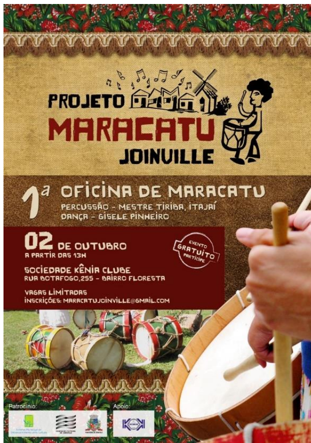
Figura 2 – Cartaz de divulgação do Projeto Maracatu Joinville, 2010

ao público. A Figura 2 é o cartaz de divulgação das oficinas realizadas após a aprovação do projeto cultural submetido ao Simdec, em 2010.