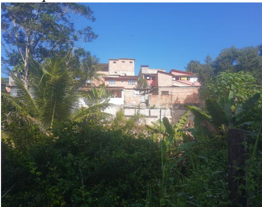
Vista parcial del barrio Trancosinho