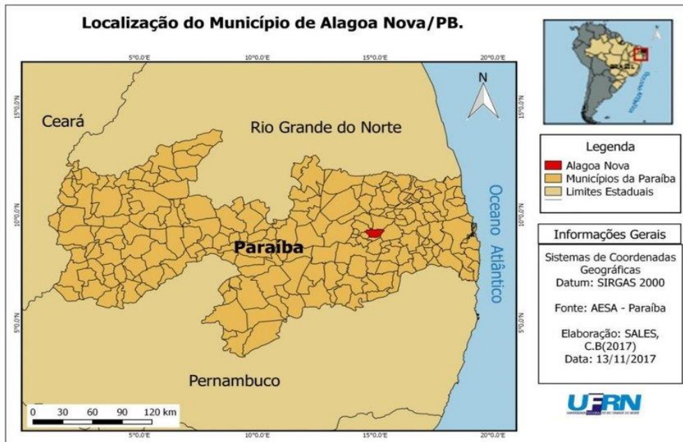
Mapa del Municipio de Alagoa Nova - PB