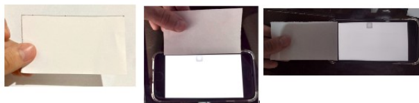
Figura 3: Validação do procedimento.

Para validar o procedimento, foi utilizado o iPhone SE 2, da empresa Apple que possui tela de 4,7 polegadas com resolução 750 x 1334 pixels . Após a realização dos cálculos, um molde da tela foi traçado em papel A4, recortado e colocado sobre o dispositivo para conferir a correspondência com o tamanho real da tela.