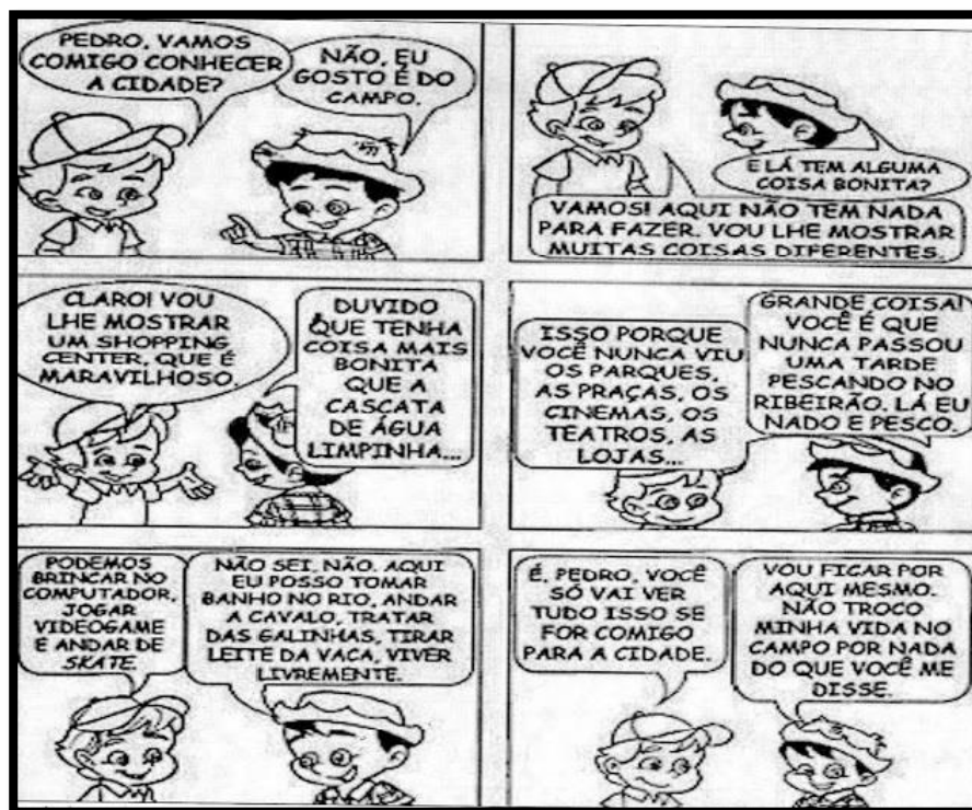
Figura 01: Diálogo Campo x Cidade.

Fonte: Blog; http://profclaugeohist.blogspot.com.br/2011/08/diferenca-entre-campo-e-cidade.html