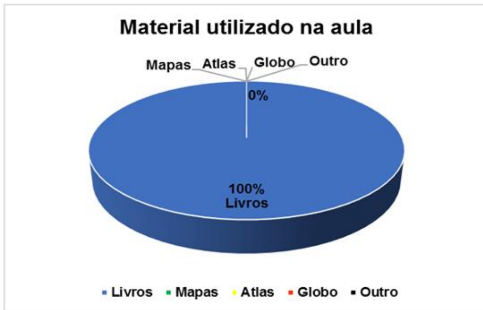
Figura 2 - Materiais utilizados pelo professor

Quanto aos conteúdos geográficos, Figura 3, 12% das respostas apontam que há debates dos conteúdos de geografia em sala de aula, em contrapartida a maioria, 84% responderam que “as vezes” acontecem debates e 4% responderam que “nunca” há debates.