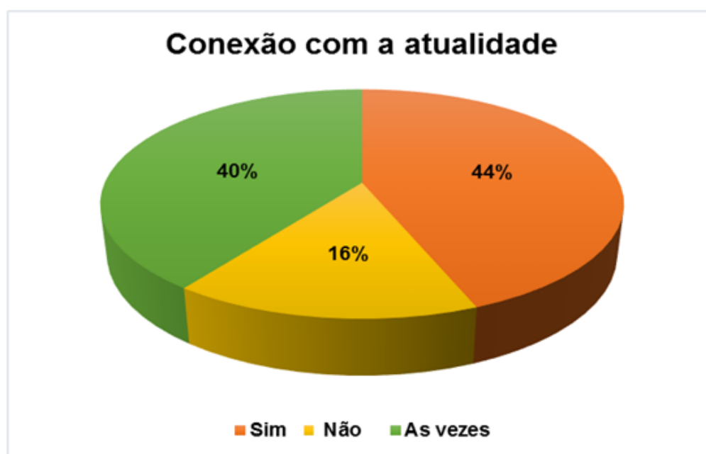
Figura 4 - Conteúdos abordados X Atualidade

Diante disso, os alunos foram questionados se os conteúdos geográficos se relacionam com a contemporaneidade. Conforme mostra a Figura 4, para 44% das respostas a conexão com a realidade se faz presente nos conteúdos abordados, 16% não conseguem visualizar essa relação e 40% declaram que as vezes a atualidade é observada.