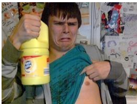
Figura 01: Imagem que revela a prática de Cyberbullying

publicações que vão ao encontro do que Amanda expressou, como se pode visualizar na imagem que trazemos, a seguir: