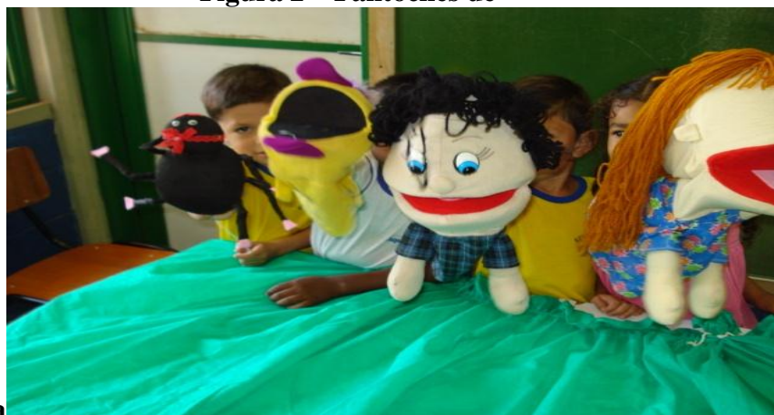
Figura 2 – Fantoches de

Na arte de contar histórias existem vários tipos de recursos, desde os mais sofisticados, aos mais simples e improvisados, isso dependerá da realidade onde se encontra o professor/contador de histórias. Vejamos alguns selecionados: