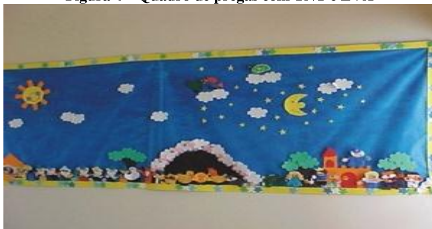
Figura 4 – Quadro de pregas com TNT e EVA