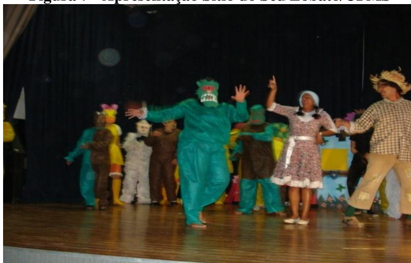
Figura 7 - Apresentação Sítio do Seu Lobato/UFMS