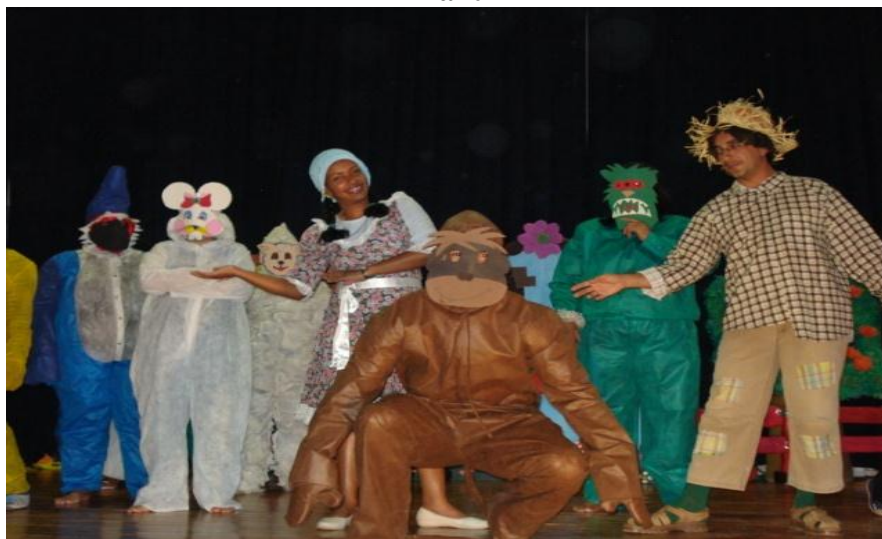
Figura 3 – Fantasias apresentação Seu Lobato I UFMS/Semana da Literatura Infantil

precisa tornar um pouco de cuidado, pois existem crianças que ficam com medo de alguns personagens como bruxas, macacos, palhaços, entre outros. Porém são interessantes recursos que o professor pode utilizar para enriquecer suas histórias na hora da contação. As fantasias como de monstros, bruxas, saci, cuca, podem ser usadas para um público de faixa de etária entre os 7 e 8 anos, as crianças nas idades pré-escolares são preferíveis fantasias mais leves como um chapéu, uma camisa florida ou um caipira, uma boneca, algo menos assustador.