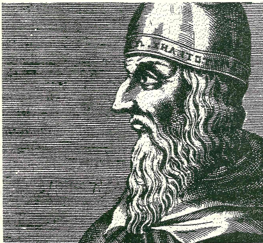
Aristóteles, maior filósofo grego e preceptor de Alexandre Magno.

Já em Roma, a aspiração pedagógica se resume à formação do orador. Até por esse motivo aí se desenvolve um incipiente nível de ensino superior tendo como pedra angular a atividade didática dos retores . A retórica hegemoniza a proposta pedagógica quando o dirigente necessita dominar a arte que o habilita a realizar um discurso elegante e rebuscado visando persuadir a platéia. Essa focalização privilegiada sobre a retórica, contudo, abriu espaço para a decomposição da proposta pedagógica que a embasava. Claro que isto não resulta de uma determinação interna à educação. O próprio Império Romano, abatido pelo seu gigantismo, dilacerado pelas disputas internas, incapaz de manter a eficácia da exploração escravista, é a moldura do quadro educacional apontado. O Satiricon de Petrônio é um registro fundamental desse momento de desagregação do Império. Determinado por esse processo de desagregação, o ensino de retó-