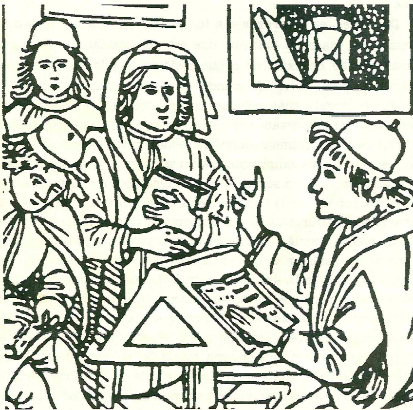
Estudantes e professor de uma universidade medieval: gravura reproduzida do frontispício de um antigo manual de estilo epistolar.

É a Descartes que principalmente devemos o ter saído do jugo desta barbárie; este grande homem desenganou-nos da filosofia da escola (...). A Universidade de Paris, graças a alguns professores verdadeiramente esclarecidos, livra-se insensivelmente desta lepra; no entanto ainda não está completamente curada. Mas as universidades de Espanha e de Portugal, graças à Inquisição que as tiraniza, são muito menos avançadas; nelas a filosofia está ainda no mesmo estado em que entre nós esteve do século XII até ao século XVII; os professores chegam a jurar que jamais ensinarão outras: a isto chama-se tomar todas as precauções possíveis contra a luz." 5