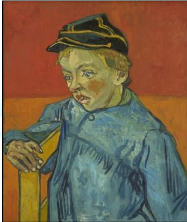
Figura 4 – Vincent Van Gogh, O escolar , 1888