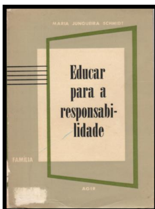
Figura 2 - Capa do livro Educar para a responsabilidade (1963).