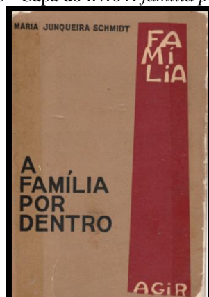
Figura 3 - Capa do livro A família por dentro