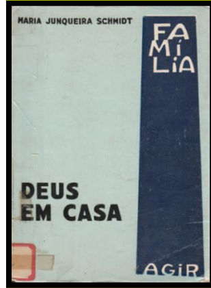
Figura 4 - Capa do livro Deus em casa