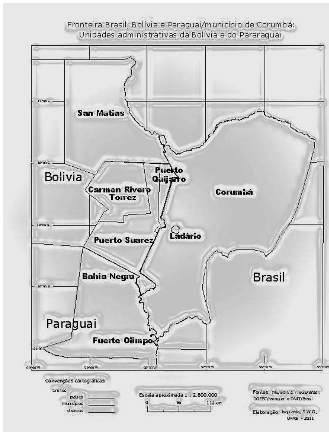
Figura 02: Área de estudo

Fazem parte desse mosaico, sete unidades territoriais político-administrativas na escala local, sendo: duas no Brasil, os municípios de Corumbá e Ladário; três na Bolívia, os municípios de San Matías, Puerto Suárez e Puerto Quijarro; e duas no Paraguai, os municípios de Bahía Negra e Fuerte Olimpo.