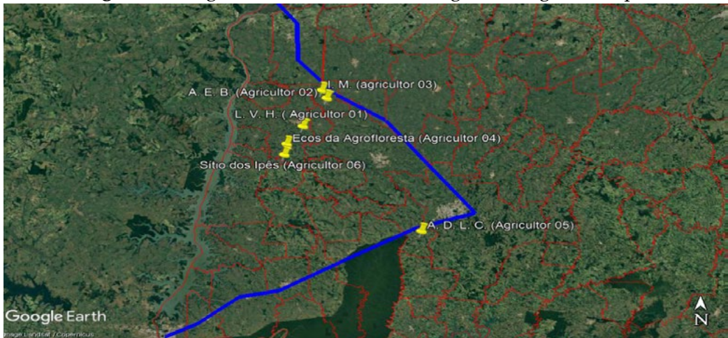
Figura 2- Imagem do oeste do Paraná, região do lago de Itaipú

Legenda: Em azul a delimitação média da Bacia do Paraná 3; ícones amarelos localização dos agricultores estudados em relação à bacia