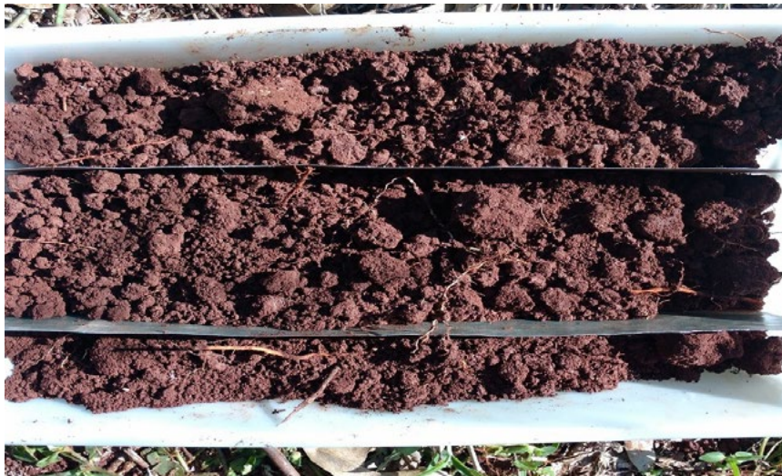
Figura 5- Agrofloresta com mais de 40 anos de manutenção e de implantação

Nas amostragens dos agricultores com agroflorestas mais antigas, foram também percebidos escurecimento dessas camadas superficiais (Figura 5).