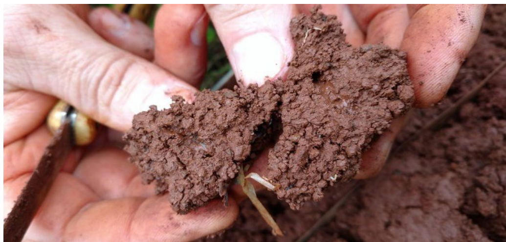
Figura 6- Agregados com excelente porosidade, granulometria e atividade biológica. Amostra da agrofloresta de Entre Rios do Oeste, com 4 anos de implantação, visualiza-se galerias feitas pelas minhocas

A Figura abaixo foi coletada na região, mais antiga da agrofloresta do produtor 06, e vem reforçar aquilo que vem sendo afirmado, o local da coleta, que antes do crescimento das árvores era utilizado para cultivo de verduras nas entrelinhas das árvores, mostra o resultado prático da atividade microbiana, na construção de galerias, grumos, coloração e coesão e permeabilidade do solo.