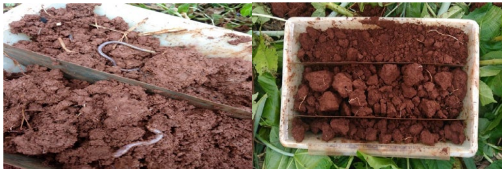
Figura 3 (esquerda) e 4 (direita)- Descrição do perfil do solo nas propriedades visitadas

Com o fator tempo atuando nos sistemas agroflorestais, foram ocorrendo alterações, percebidas pelo escurecimento principalmente da primeira camada amostral ou camada "a". O que sugere o aumento de matéria orgânica ou Carbono microbiano, fato muito bem percebido no solo da Agroflorestra do Agricultor 06, que apresentou cor mais escura (Figura 3) nas amostras da parte mais antiga (4 anos de SAF), e na parte recentemente instalada, (Figura 4, apenas 6 meses) cor mais clara e com solo solto e desagregado.