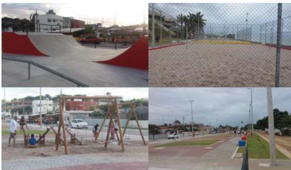
Figura 3: Equipamentos esportivos e de lazer, orla da praia de Jacumã

As obras envolvem completa requalificação da orla da praia de Jacumã, com a construção de quadra de futebol e areia, quadra poliesportiva, pista de skate e um playground (Figura 3).