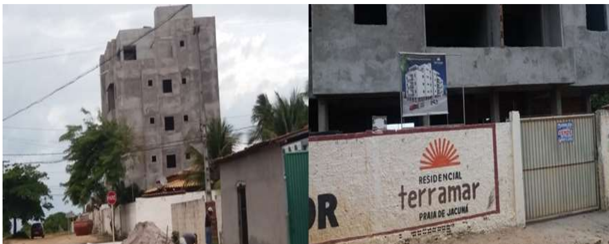
Figura 4: Verticalização próxima da orla da praia de Jacumã

verticalização (UEDA, 2012), principalmente nas ruas próximas da praia, onde edifícios de quatro/cinco pavimentos estão sendo construídos (Figuras 4 e 5).