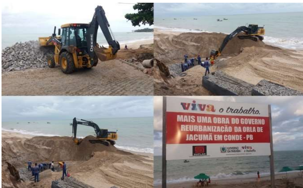
Figura 2: Obras na orla da praia de Jacumã