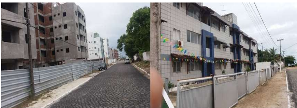
Figura 5: Verticalização próxima da orla da praia de Jacumã